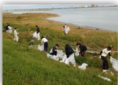
アドプトプログラムの様子

吉野川河川敷や国道 11 号線（東吉野町二丁目付近）の本社前道路の清掃・美化活動を定期的に行っています。