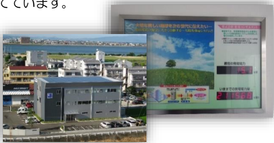
新館屋上に設置している太陽光パネルと太陽光の発電量がわかるパネル

社屋屋上に太陽光発電（出力 30Kw）を設置し、発電した電力は社屋内の照明等の一部に使用しています。また、発電量が一目で確認できる表示装置を設置し、社員の環境への意識向上に役立っています。