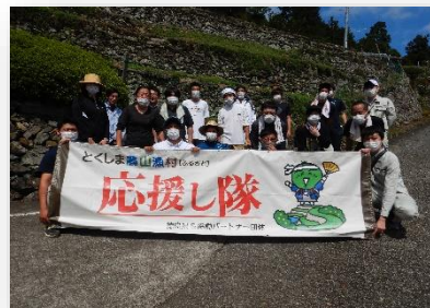
吉野川市美郷地区の景観整備ボランティアとして参加