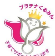
認定通知証とプラチナくるみんマーク