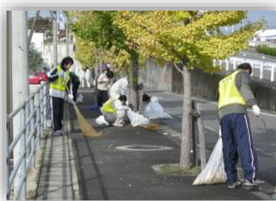
ボランティア・サポート・プログラムの様子